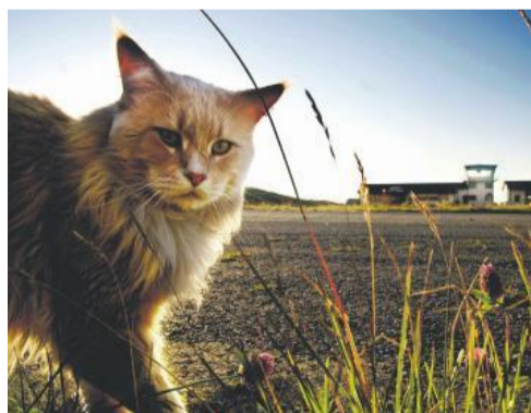
GÅRDSKATT: Variax er av typen Maine Coon, og utgjør en trussel for smådyr på flyplassen.

Da Avinor i 1986 flyttet passasjerfrakten på Værøya fra helikopter til fly, var valget av sted for flyplassen omstridt. På tross av lokalbe-